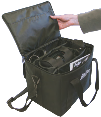
Sacoche fourre-tout pour accessoires FreeStyle 5 Référence : MI372-1