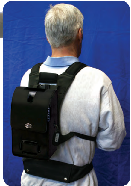
Harnais « sac à dos » pour sac de transport convertible Référence : MI284-1